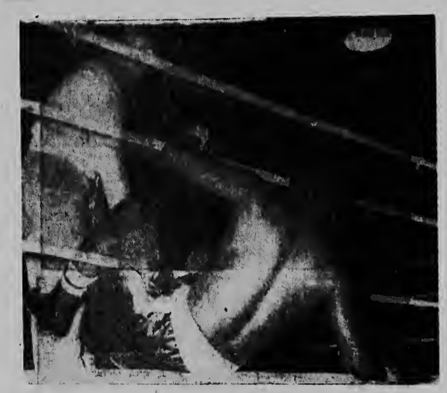
Un di e momento emocionante: Sugar Boy Nando ta benta Garraway for di cabocja, ku a tuma lugar dia Sabra anochi den Swingsters Square Garden